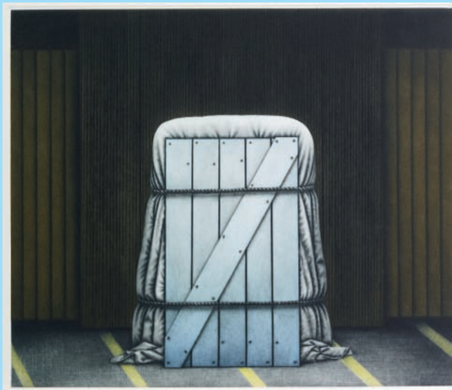
3011 Marc Balakjian

3114 HEUER, PAULA. (*1907 Schübelbach). Sphinx, 1950. Öl auf Pavatex, rechts unten signiert und datiert: 6.50 P. Heuer, verso bezeichnet. 58 x 58. Provenienz: Nachlass Annemie Fontana, Zumikon. CHF 150.-/180.- (€ 100.-/120.-)