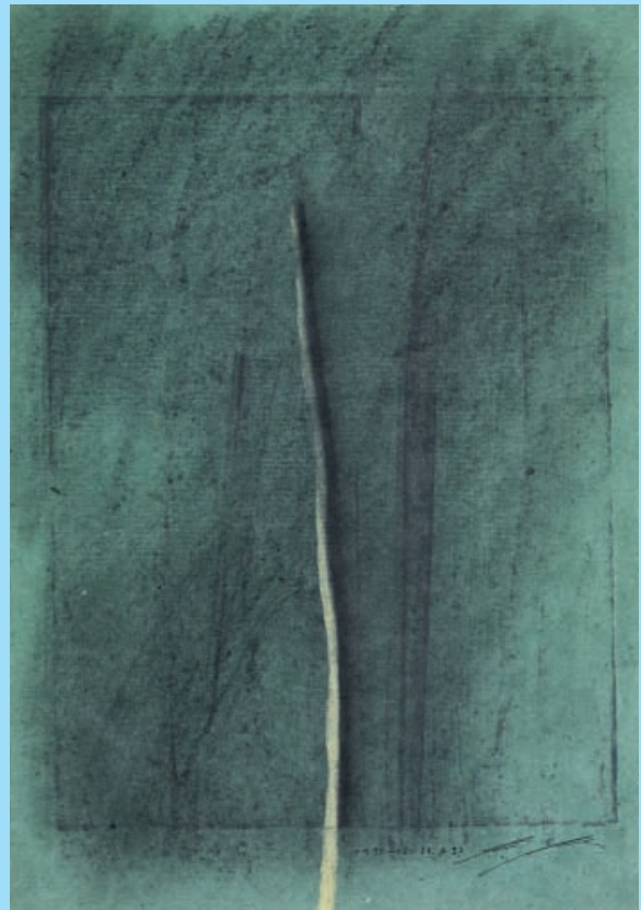
3074 Werner Ewers

3247 -. Komposition, 1965. Serigraphie auf schwarzem Papier. Exemplar 1/50, rechts unten signiert und datiert: G. Secomandi 1965, links unten mit Prägestempel der Guilde Int. de la Serigraphie . BG 70 x 50; DP 58,5 x 44. CHF 300.-/400.- (€ 210.-/280.-)