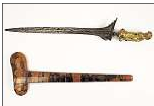
Krisse: wertvolle indonesische Ritualmesser aus Bali.

Die Auktion für die Antiquitäten findet am Donnerstag, 23. September, um 14.30 Uhr statt und wird von der Sammlung von Martin Kerner dominiert. Es sind ungefähr hundert Kris, indonesische Ritualmesser mit reich verzierten Griffen und kunstvoll verarbeiteten Klingen aus dem 19. und 20. Jahrhundert. Dabei kommen einfache Krisse zwischen 150 und 200 Franken, aber auch edle Beispiele mit 22 Karat Echtgold-Pendok (Ummantelung der Scheide) zur Verstei-