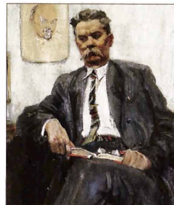
Portrait von Gorky des armenischen Malers Mikhail Abdullayev.

Die Ausstellung ist ab heute bis am Tag vor den Auktionen zu sehen. Die Objekte der ganzen Auktionsserie sind mit Foto und Beschreibung auf der Website abrufbar, wo für jedes Objekt be-