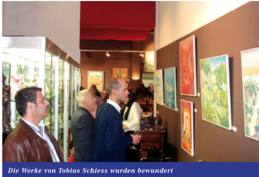
Die Werke von Tobias Schiess wurden bewundert

«Tobias Schiess» Den Zürichsee Auktionen war es gelungen den ganzen Nachlass des vor kurzem verstorbenen Malers Tobias Schiess auszustellen. Die über 50 Ölbilder und die vielen Zeichnungen und Gouachen