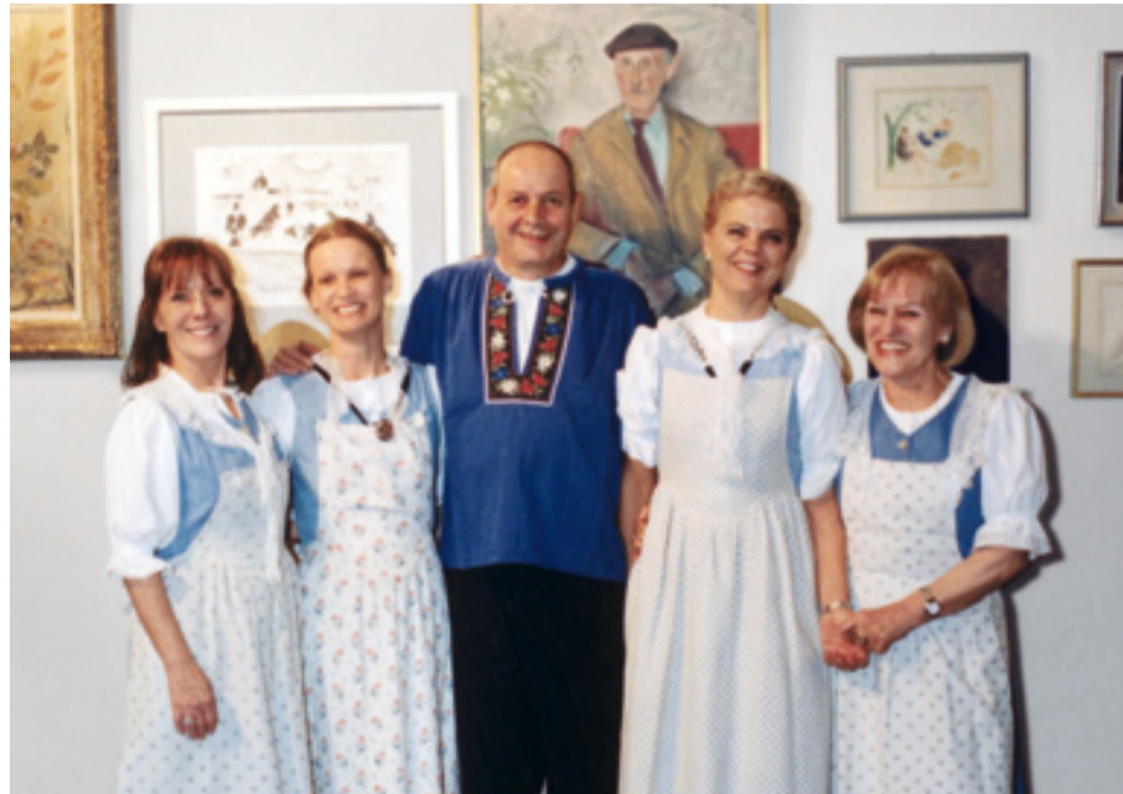
Das ganze Zürichsee Auktionen-Team passend zur Ausstellung der Zürichsee-Maler in Trachten gekleidet